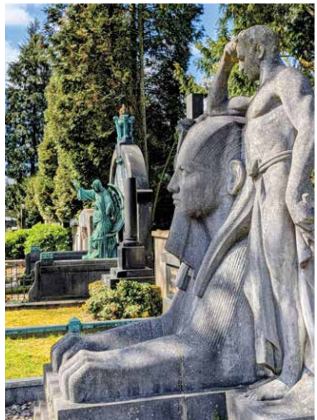
Grabmale auf der Millionenallee